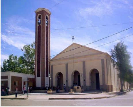
Iglesia de San José de Jáchal