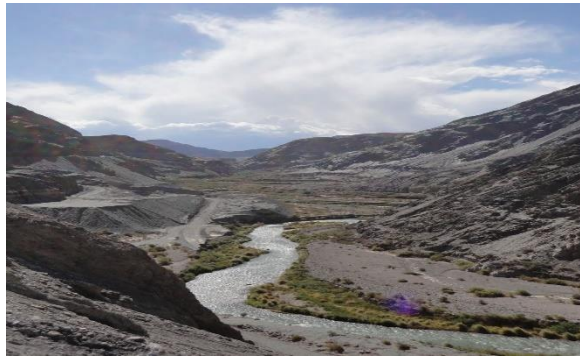
Camping Agua Negra