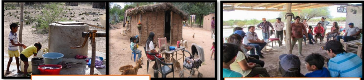
Habitantes de la "Laguna de Guanacache".