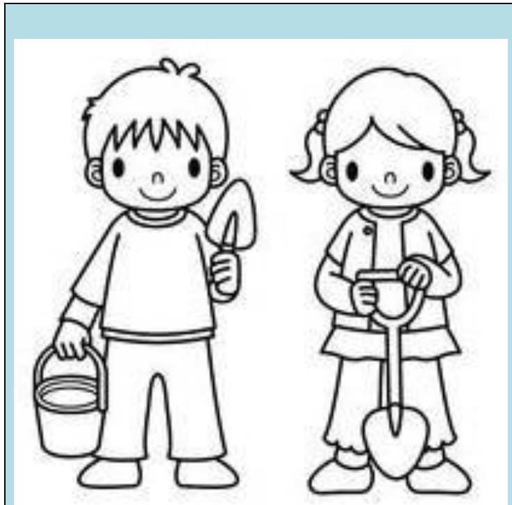
COLABORAR EN LA HUERTA FAMILIAR.