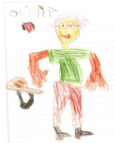
Imagen a modo de ejemplo

A realizar una gran obra de arte, el pequeño debe elegir una persona de la familia, un amigo, el abuelo, etc. y deberá realizar un dibujo, de lo que más le guste a él para regalarle de obsequio, una vez finalizado el mismo, colocará al final de este o en algún lugar de la hoja a modo de firma su nombre.