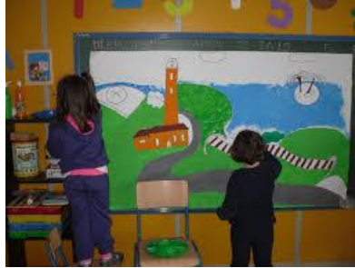
Imagen a modo de ejemplo.

DÍA 3: En una hoja realizamos paisaje con témperas, lápices lo que tengamos en casa, pintamos el cielo, la calle y el agua.