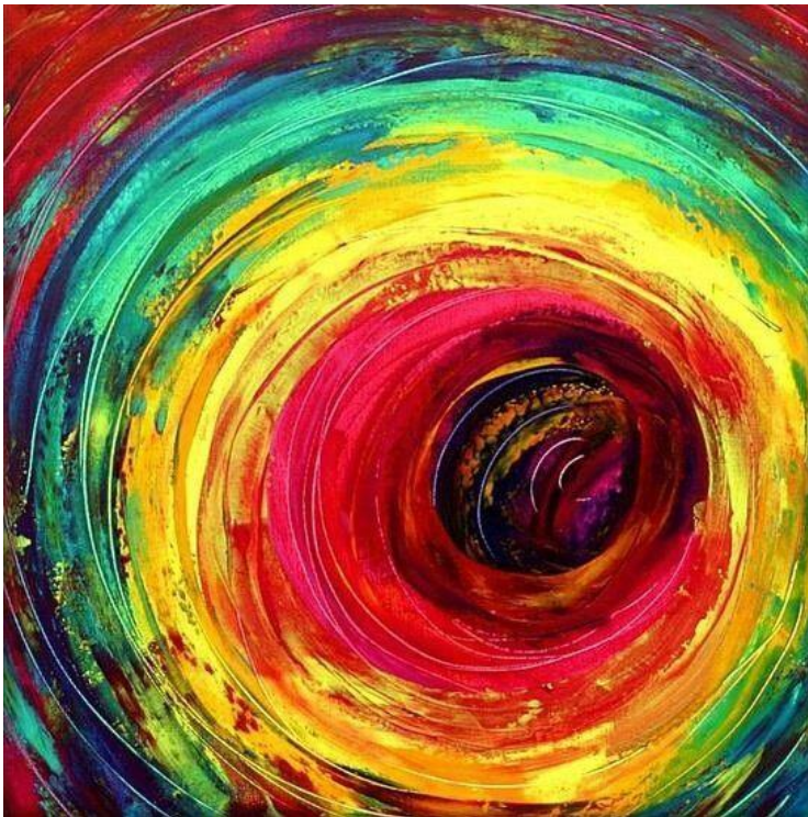
“Pin de Yei en túnel” – arte abstracto en colores