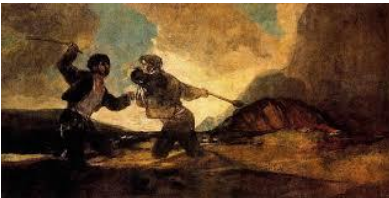
“Duelo a garrotazos” – Francisco Goya