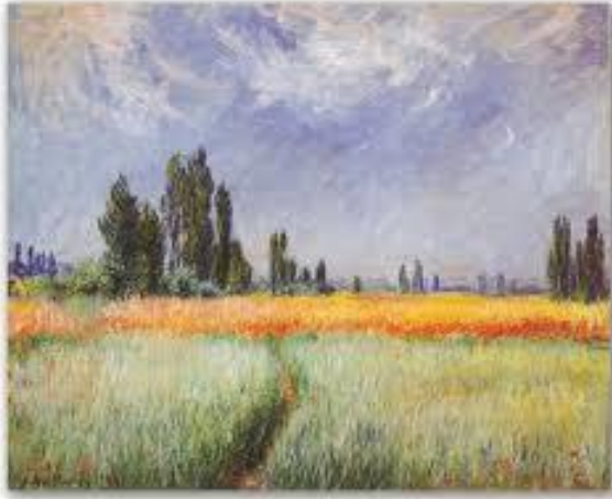
“Campo de trigo” – Claude Monet