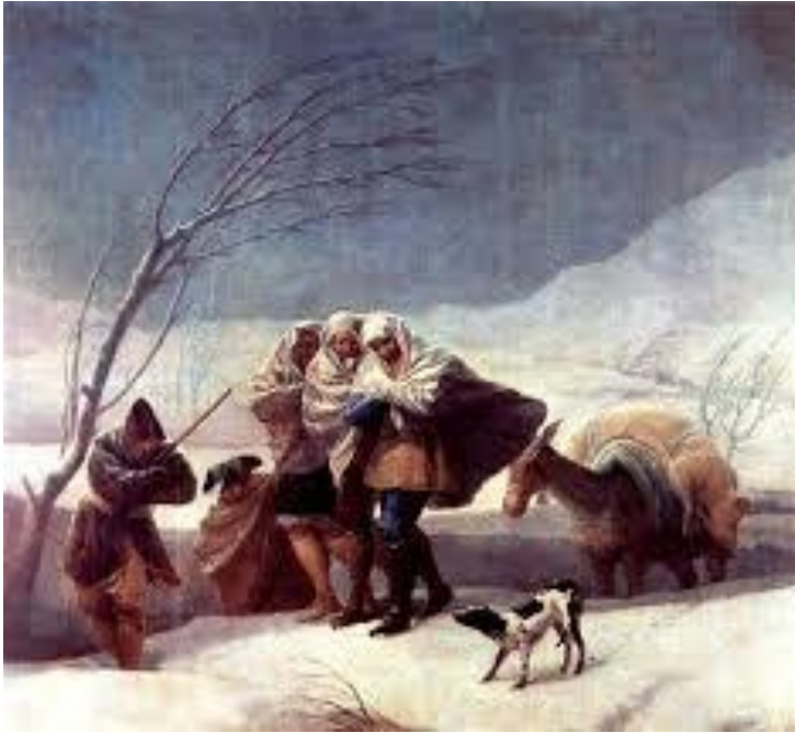
“Tormenta de nieve” – Francisco Goya