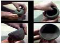
IMPRESIÓN O PRENSADO