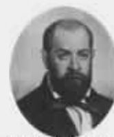
Domingo F. Sarmiento