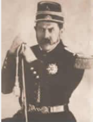
Sarmiento en el ejército de Urquiza