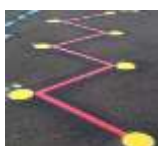
FIGURAS DE EJEMPLO

Cada alumno deberá comenzar el circuito realizando zig-zag en velocidad, y al finalizar éste, saltar con apoyo de un solo pie antes de la primera línea de la tabla de salto, donde deberán caer con los dos pies juntos, teniendo en cuenta que mientras más líneas superan, mayor es la amplitud de salto que realizan. Luego deberán recorrer el abecedario, saltando con un solo pie, mientras lo apoyan en cada letra de sus nombres. Seguido a esto, desplazarse en cuadrúpeda hasta llegar al tablero de juego, donde deberán seguir las indicaciones de cada línea, apoyando manos y pies derecho o izquierdo según corresponda. En caso de equivocarse antes de finalizar, deberán comenzar desde el inicio del circuito.