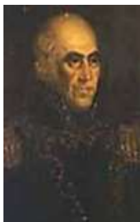
Juan José Paso Secretario