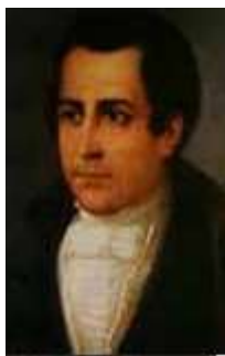
Mariano Moreno Secretario