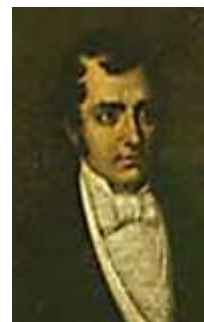
Juan José Castelli Vocal Orador