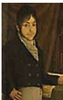
Juanarrea Vocal Comerciante