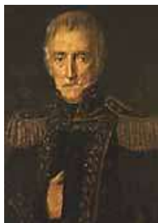
Cornelio Saavedra Presidente