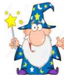
El Mago Cascarrabias