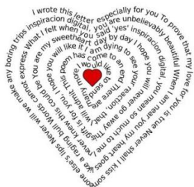
Caligrama de Amor

Fíjate en estas imágenes otros ejemplos de caligramas.