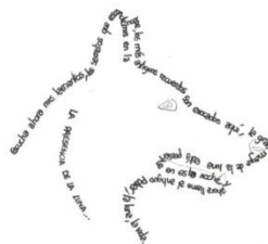
Caligrama de un Amigo