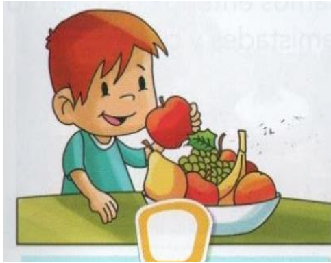
COMER FRUTAS, VERDURAS, LÁCTEOS Y CARNES.