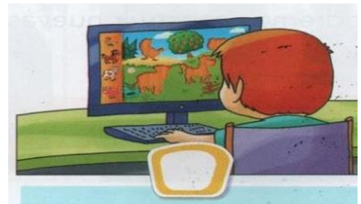
PASAR MUCHAS HORAS FRENTE A LA COMPUTADORA.

3. AYUDA A LOS PEQUEÑITOS A ENCONTRAR EL ELEMENTO QUE NECESITAN PARA CUIDAR SU HIGIENE. (UTILIZA DISTINTOS COLORES).