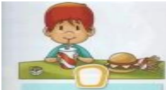
CONSUMIR GASEOSAS Y HAMBURGUESAS EN EXCESO.