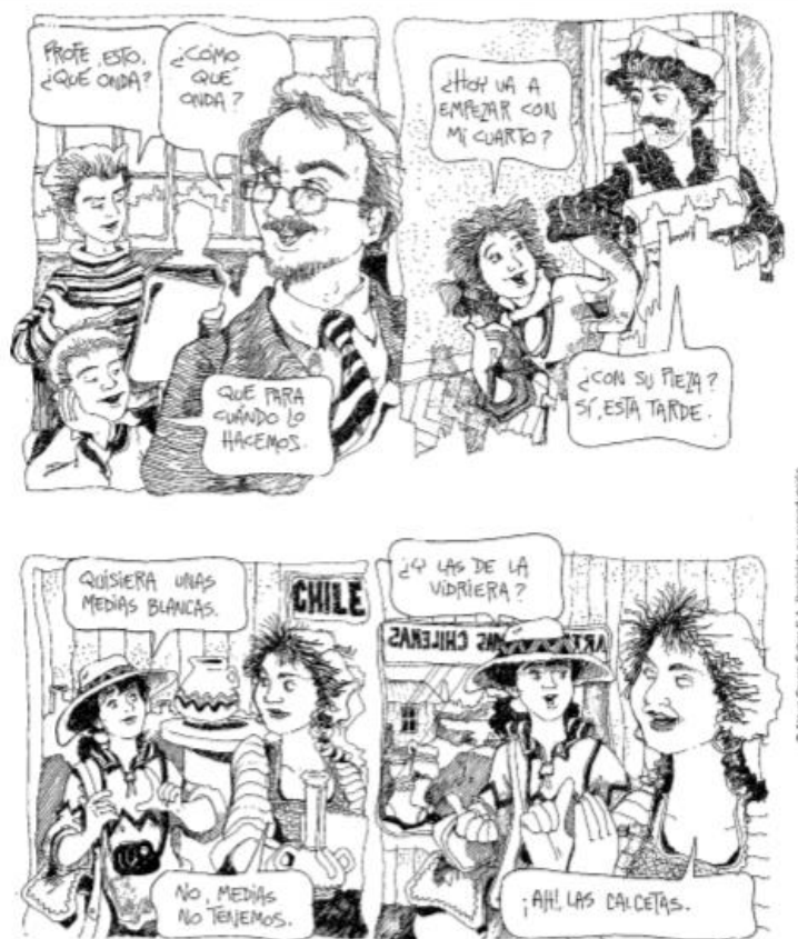
En las escenas anteriores, todos los que hablan comparten el idioma castellano o español, pero en cada escena se produce algún problema de comprensión.

Para recordar: Todos los hablantes que pertenecen a una misma comunidad lingüística hablan el mismo idioma, el castellano, sin embargo, no todos los usuarios se expresan de igual manera.