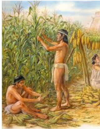
TRIBU CACIQUE HUAZIHUL