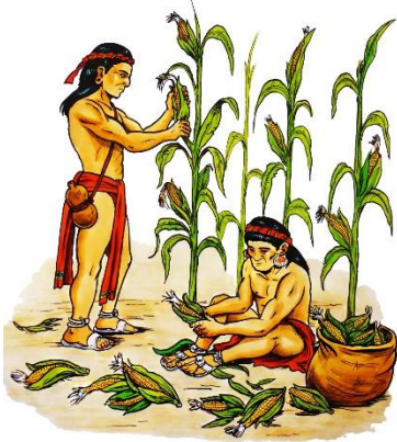
TRIBU CACIQUE PIE DE PALO