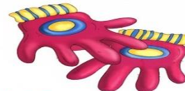
Los guantes CM