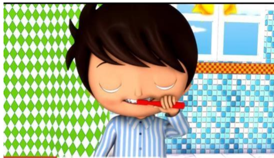
Así es como se lavan los dientes | Canciones infantiles | LittleBabyBum