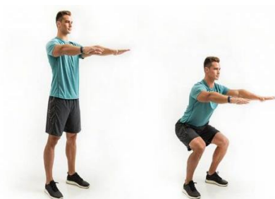
Varones 12 repeticiones