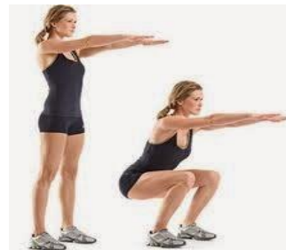
Mujeres 8 repeticiones