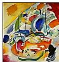
Improvisation 31 (Sea battle)