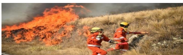
Incendios. Dos focos activos este martes

Por las altas temperaturas y las ráfagas de viento, el riesgo por el fuego continúa siendo extremo. Afirman que las precipitaciones registradas en los últimos días no consiguieron humedecer el material combustible en las zonas más secas.