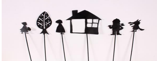
IMAGEN A MODO DE EJEMPLO