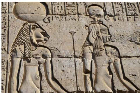
RELIEVE DE LA CULTURA GRIEGA