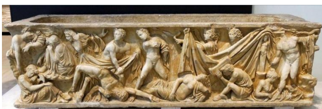
CULTURA EGIPCIRELIEVE DE LA CULTURA ROMANA