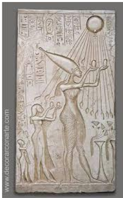
RELIEVE DE LA CULTURA EGIPCIA.

TENIENDO EN CUENTA LO QUE LEÍMOS Y EXPLICAMOS SOBRE ALTO Y BAJO RELIEVE , TE PROONGO QUE OBSERVES LAS SIGUIENTES IMÁGENES E IDENTIFIQUES A QUÉ TIPO DE RELIEVE PERTENECEN.