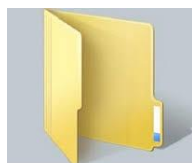
Ejemplo de Carpeta de Windows: