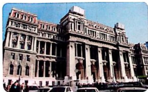
Los jueces son los encargados de hacer respetar las garantías constitucionales. Edificio de Tribunales en la Ciudad Autónoma de Buenos Aires.

Existen también otras garantías a las que tienen acceso los ciudadanos en determinados casos y que tienen como objeto la rápida defensa de derechos que de otra manera se verían vulnerados: el recurso de amparo , el habeas corpus o el habeas data .