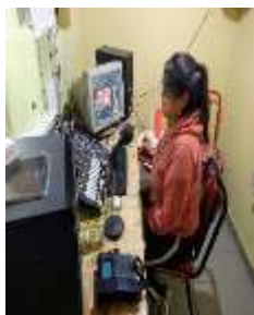
Sala de operación