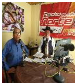
Sala de locución