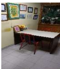
Mesa de entrada