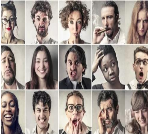
La rueda de las emociones

E) Rodea por las emociones que pasaste durante la cuarentena y/o receso escolar, escribe si pudiste solucionarla y de qué forma