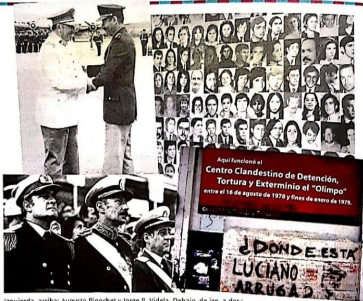
izquierda, arriba: Augusto Pinochet y Jorge R. Videla. Debajo, de izq. a der.: Massera, Videla y Agosti. A la derecha, imágenes de los desaparecidos y frente del CCD Olimpo.

Entre las décadas de 1960 y 1980, en América Latina se produjeron distintos golpes de Estado que instalaron en la región dictaduras que interrumpieron la ampliación de derechos a los ciudadanos propuesta por los movimientos sociales. En algunos países, esos gobiernos de facto transformaron económica y políticamente las sociedades, y llevaron a cabo violaciones masivas y sistemáticas de los derechos humanos, muchas de las cuales aún hoy se siguen investigando.