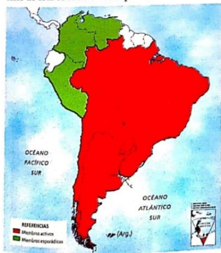
Doc. 3 Países participantes en la Operación Cóndor.

Decenas de militantes y simpatizantes de izquierda chilenos, uruguayos, paraguayos, brasileños y bolivianos establecidos en la Argentina fueron capturados por agentes policiales de sus respectivos países en el contexto de esta coordinación represiva.