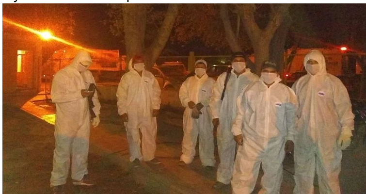
Recolectores de basura y choferes de colectivos se protegen.

En dicho municipio se suspendieron las actividades dirigidas a los vecinos y se redujo personal en el edificio.