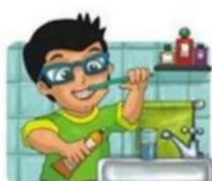
Lavarse los dientes