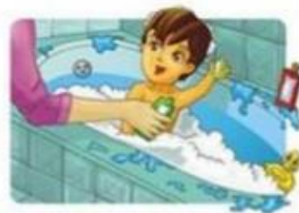
Bañarse o ducharse