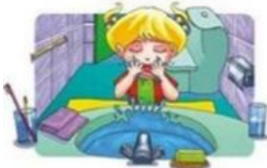
Lavarse la cara