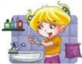
Lavarse las manos