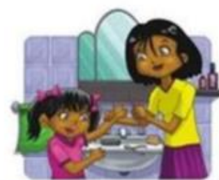
Cortarse las uñas