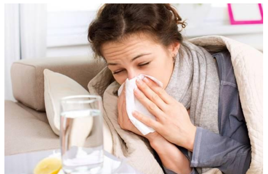
RESFRIO - TOS, CONESTION NASAL