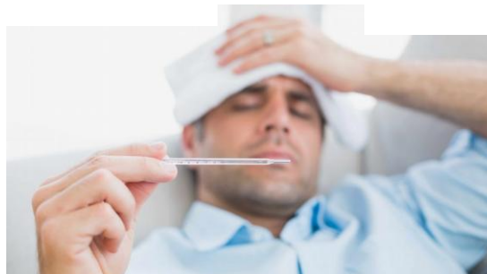
CORONAVIRUS – FIEBRE