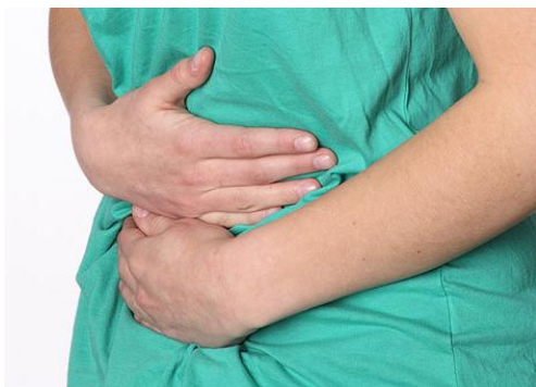
DESCOMPOSTURA – DOLOR DE PANZA