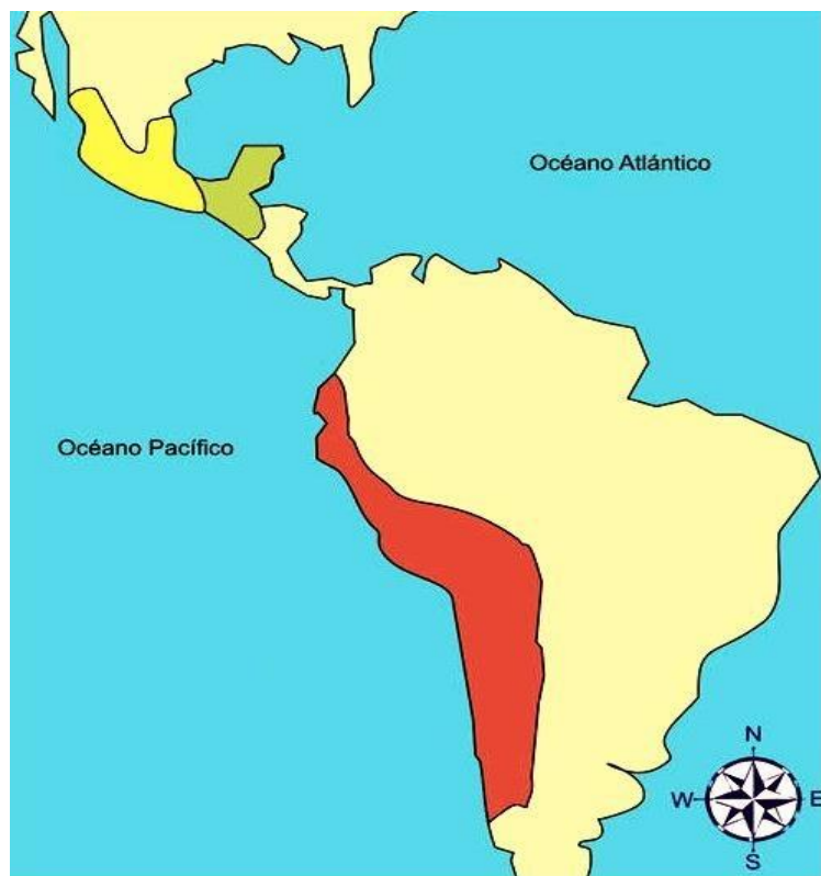
Imagen 5 Mesoamérica y región Andina.