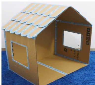
Casa de cartón

contaran cuantos ambientes tiene (cocina, comedor, baño, habitación, patio, etc.). Una vez contados los ambientes, confeccionarán una casita. Para confeccionar la casita pueden usar cajas o cartón que tengan en casa, en familia armaran la casa y de acuerdo a la cantidad de ambientes que tengan es en casa es en cuanto van a dividir, por ejemplo, si mi casa tiene 3 ambientes (baño, cocina-comedor, habitación) dividieran en 3 partes. Una vez que confeccionen la casa con los ambientes. Empezarán a equiparla, con dibujos hecho por los chicos.