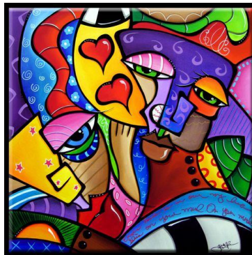
Imagen a modo de ejemplo:

Actividad día 2 (trabajamos matemática y terminamos la tarea de artes visuales)