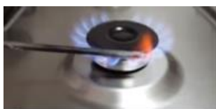
Sostener el clavo con la pinza durante 3 minutos