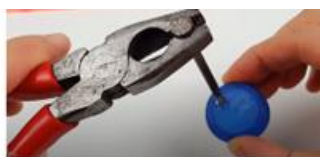
Perforar con varios orificios