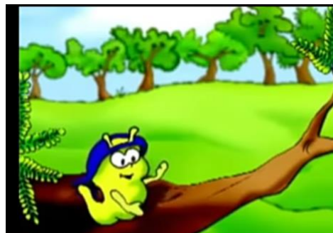
El cuento de una familia feliz