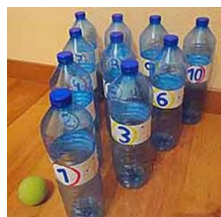
juegos de bolos con botellas