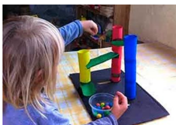
Laberinto de bolitas 3D