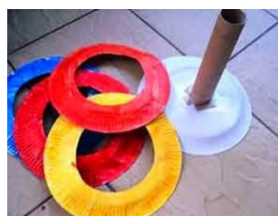
Con tubos y platos de cartón: "Juego de emboque"