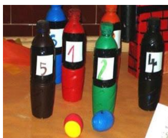
Botellas con números