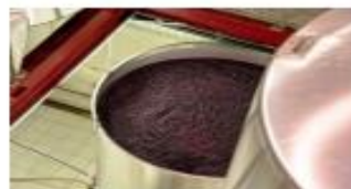
Maceración y Fermentación alcohólica