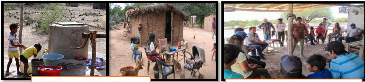
Habitantes de la "Laguna de Guanacache".

20) Observa las siguientes imágenes y responde: