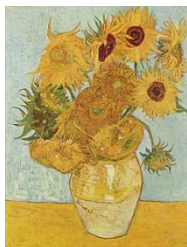
“Los girasoles” de Van Gogh”