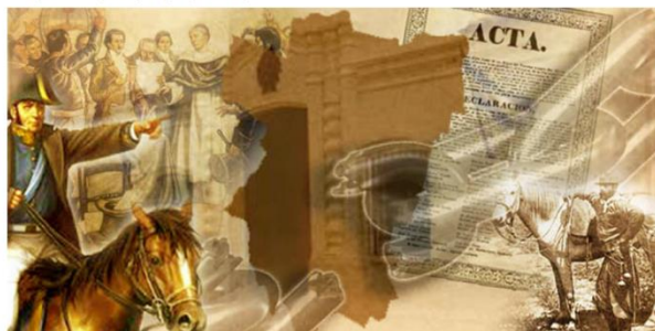
9 de Julio de 1816 en perspectiva Lucha por la emancipación y Congreso por la Independencia