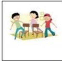
JUE__ DE LA __LLA