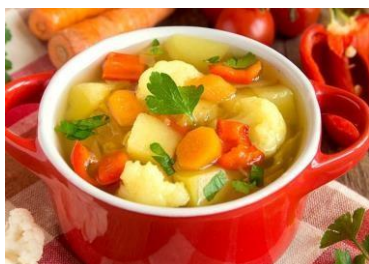
¡Que sabrosa y nutritiva sopita!

Un adulto debe pelar y cortar las verduras, en tamaños medianos. El niño debe contar los trocitos e ir agregándolos a la olla con agua fría, junto con la carne. Colocar al fuego (con ayuda de mamá), agregar sal y dejar que hiervan y se pongan blanditas. Revolver y listo para servir en la mesa.