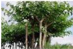
ARBOLES FORESTALES (MORA).

Los árboles forestales son aquellos que dan sombra, y los árboles frutales, como su nombre lo dice, son aquellos que dan frutos.