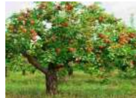
ARBOLES FRUTALES (DURAZNO).

-Investigar por los alrededores del hogar los tipos de árboles que hay. Escribir los nombres de los árboles que encontraste.