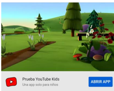
El olor de la primavera