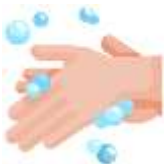
LAVADO DE MANOS

ACTIVIDAD 1: Seguimos en aislamiento preventivo social y obligatorio. Por ello debemos tener siempre en cuenta: