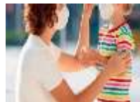
USO DEL BARBIJO