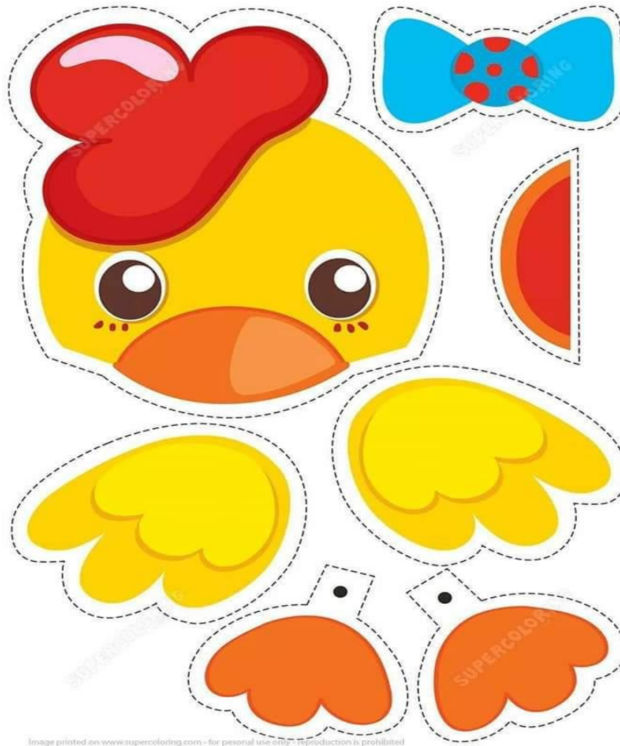
Image printed on www.supercoloring.com - for personal use only - reproduction is prohibited

Responde ¿Qué comen los animales? Investigamos con un adulto. Clasificamos en animales herbívoros, carnívoros, omnívoros Armar el rompecabezas de este animalito.