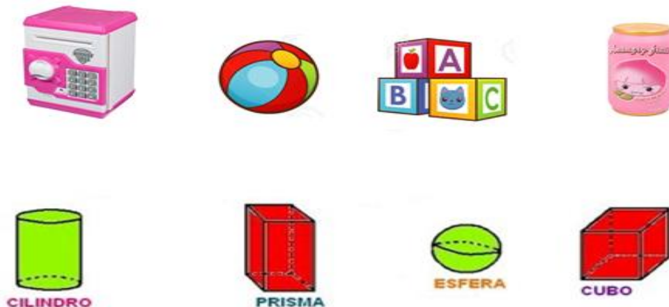
LOS CUERPOS GEOMETRICOS

LA FAMILIA DE JULIA LE COMPRÓ MUCHOS REGALOS.OBSERVALOS Y LUEGO UNÍ CON EL CUERPO GEOMÉTRICO AL QUE SE PARECE.