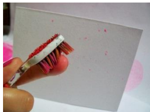
Imagen de ejemplo de actividad a realizar:

Finalizada la actividad registrar fotográficamente el trabajo y enviar a la seño de sala.