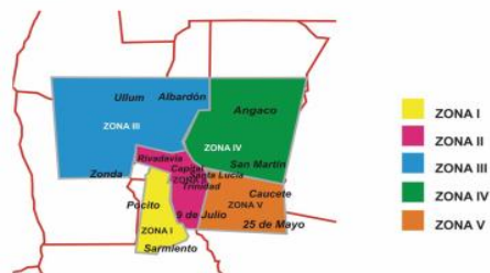
SAN JUAN - ZONAS VITIVINÍCOLAS

17-Observa estas zonas vitivinícolas y completa el cuadro