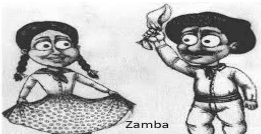
Imagen o la dibujamos.

Con ayuda de nuestra familia nombramos la vestimenta folklórica, luego pintamos la